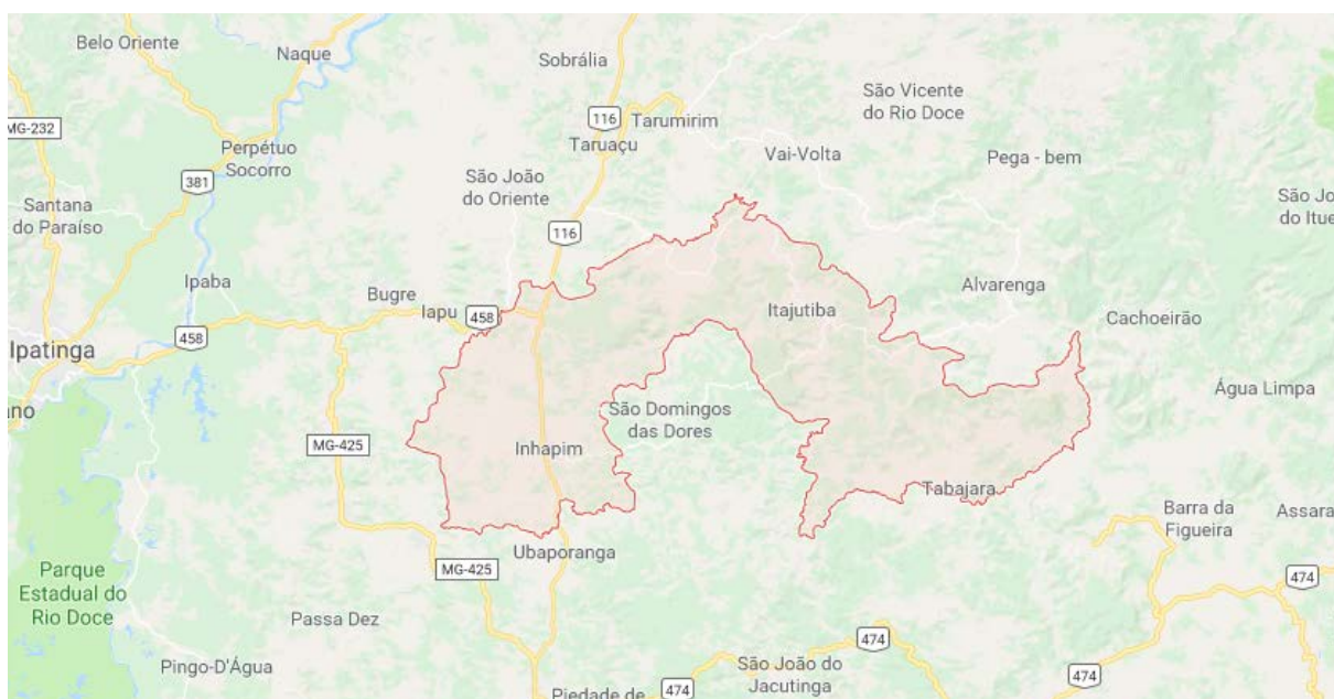
Figura 1: Localização do Município de Inhapim/MG.

O município de Inhapim está localizado no interior do estado de Minas Gerais, nas seguintes coordenadas geográficas: Latitude-Sul: 19° 33' 11", Longitude-Oeste: 42° 07' 28". Com uma área total 858 km 2 , faz divisa com os municípios de Ubaporanga, São Domingos das Dores e Entre Folhas, situa-se a 26 km norte-leste de Caratinga, a maior cidade nos arredores (CIDADE-BRASIL, 2016) (Figura 1).